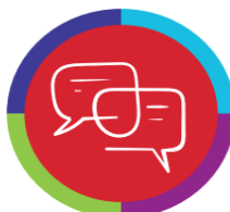
Samenwerken in dialoog