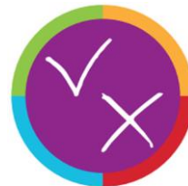
Doen wat nodig is